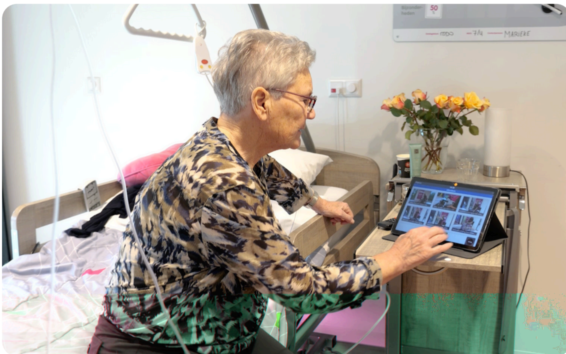
Oefenen met Compaan tijdens klinische revalidatie

Digitale hulpmiddelen – zoals de Compaan – worden in de GRZ steeds vaker ingezet om die doorlopende zorglijn daadwerkelijk te realiseren.