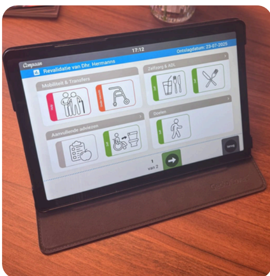
Voorbeeld digitaal revalidatiebord op Compaan

Revalidanten maken tijdens hun opname al kennis met de Compaan: zij zien hun behandelagenda, oefenen met een digitaal oefenprogramma en krijgen praktische informatie over het verblijf.